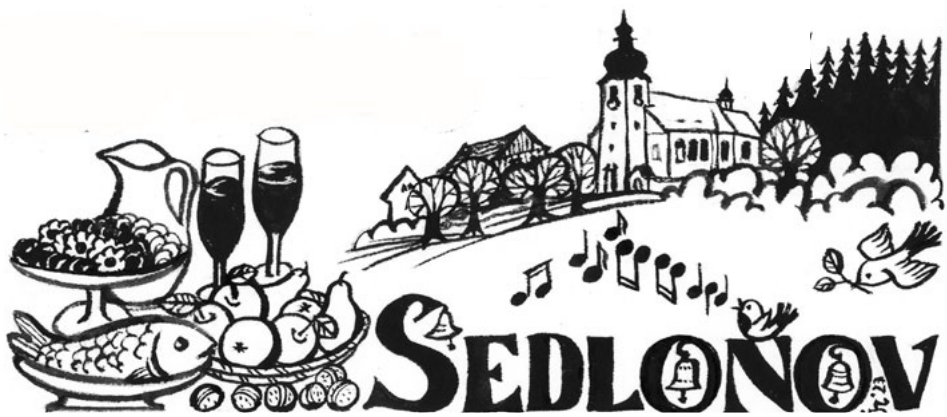
Ilustrace Jarmila Haldová